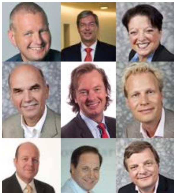
Het huidige NCD Bestuur