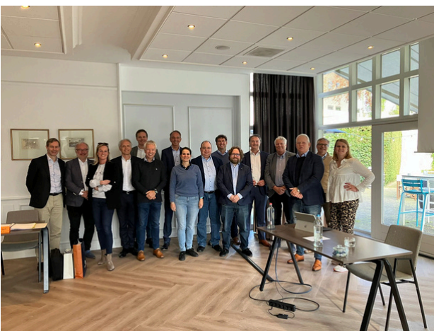
Bezoek kring Amsterdam/Vechtgebied